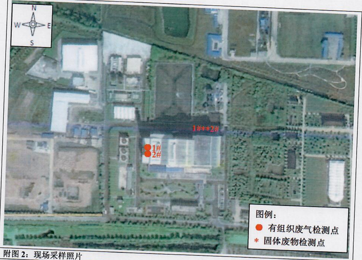
附图 2: 现场采样照片